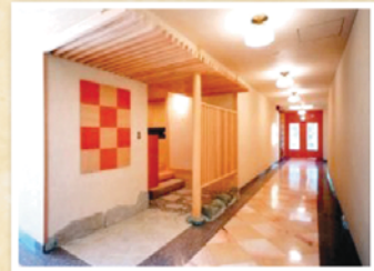
親族エントランス