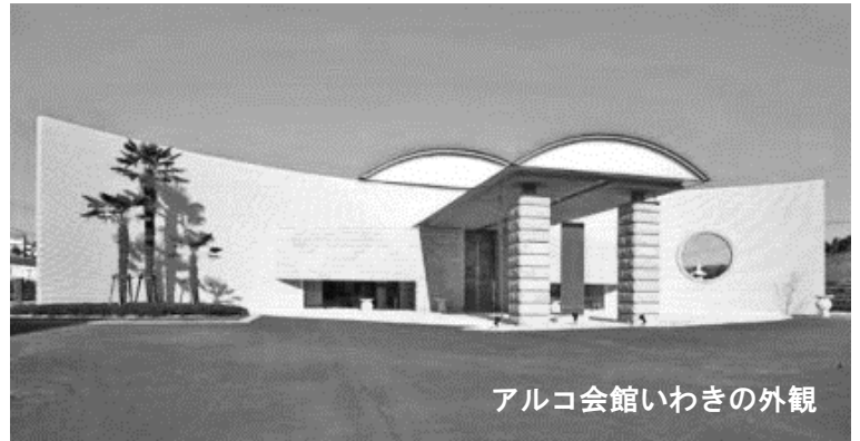
アルコ会館いわきの外観