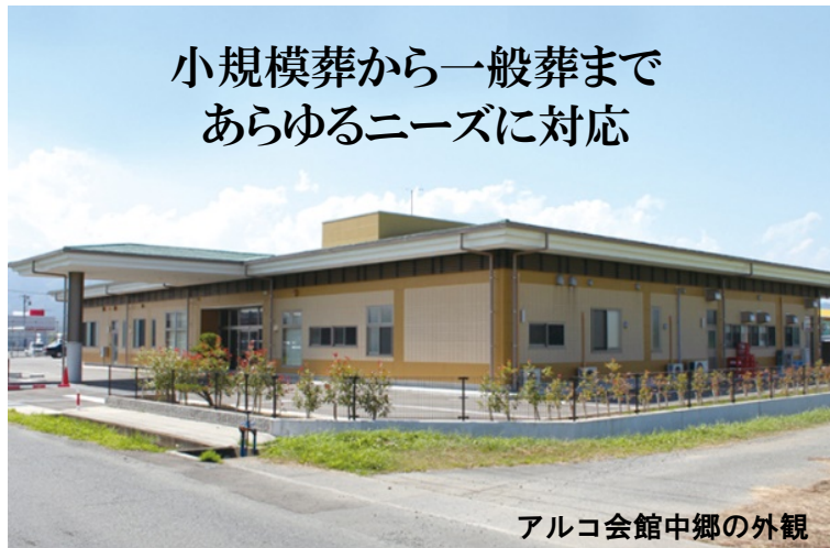
アルコ会館中郷の外観