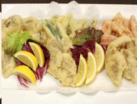
【白身魚と野菜の洋風天麩羅】 ～会場内で揚げたアツアツをどうぞ～