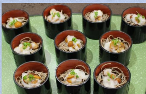
【一口季節のお蕎麦】