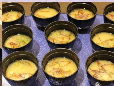
【海藻汁】 ～海の香りをお楽しみください～