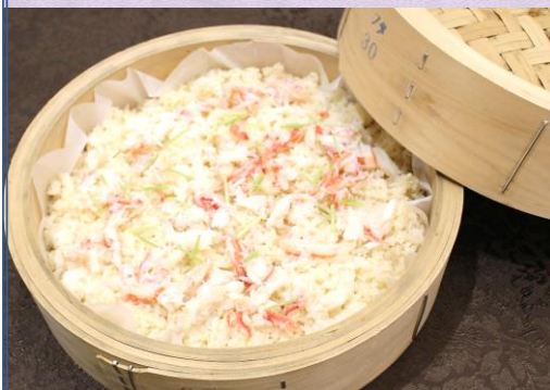
【炊き込み蟹せいろ御飯】