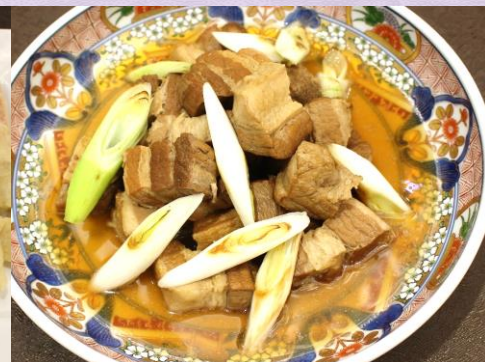
【あっさり豚肉の角煮】