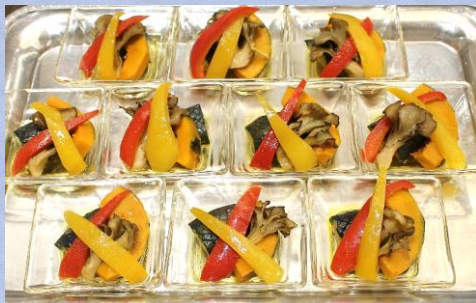
【季節野菜の揚げ浸し】