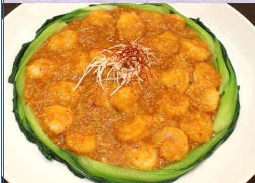
【海老のチリソース炒め】 ～長年人気のメニューです～